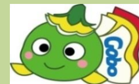
ハローワーク御坊マスコットキャラクター まめびー