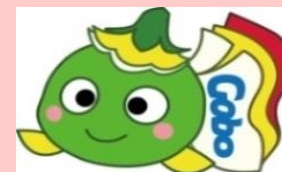
ハローワーク御坊マスコットキャラクター まめぴー