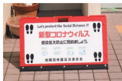
▲ 新型コロナウイルス啓発看板

10月には、菌会館に新型コロナウイルスの啓発看板を設置されました。この看板は、常時目に止まる場所に設置し、地域の住民がふと我に返って、新型コロナウイルス感染症への意識の向上と対策の確認が、いつでもだれでもできるようにしています。