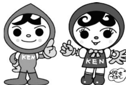
人権イメージキャラクター 人KENまもる君・人KENあゆみちゃん