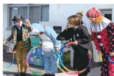
▲ 地域でのハロウィンの様子

菌自治連合会では地域ぐるみの取組として、ハロウィンや、区民を対象とした遠足をはじめとする各種催しを多数実施し、交流と親睦を深めてもらう機会を提供して、住民間のコミュニケーションの向上と連携強化を図っています。地域での催しが、地域の共助の意識を高めています。