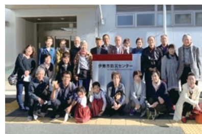
▲ 伊勢市防災センターへ研修に行きました

イベントに子どもたちが参加し、地域住民の顔を知ることによって、地域の安心・安全につなげようと日々、活動しています。