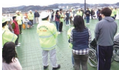
▲ 津波避難訓練の様子