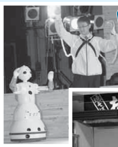
三菱重工業 ワカマル