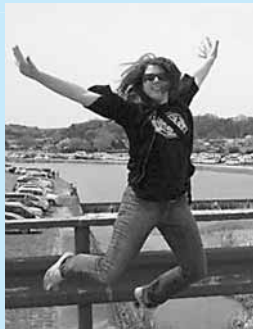
伊勢神宮の橋にて

心します。一年間その良いことを一生懸命頑張ります。たとえば、ダイエットしたり、勉強したり、早く起きたりします。でも、残念ながら、みんなほとんど負けてしまうと思います。それにもかかわらず、新年には何か良いことを決心しましょうか！