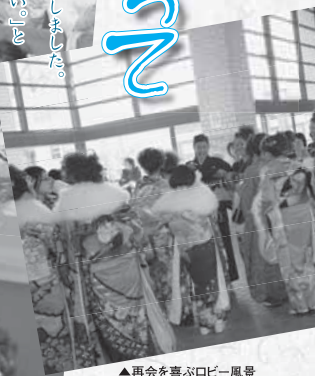
▲再会を喜ぶロビー風景