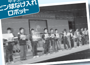
中学生の ピン球なげ入れ ロボット