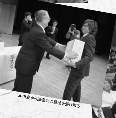
▲市長から抽選会の賞品を受け取る