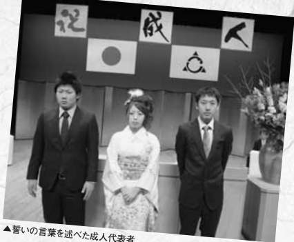
▲誓いの言葉を述べた成人代表者