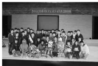
▲全国高専ロボコン大会上位4チーム

12月21日、市立体育館で「きのくにロボットフェスティバル2008」が開催されました。特設ステージでは国内と韓国企業のロボットショーや学生のロボコン大会などが行われ、来場した大勢の親子連れらが最先端のロボット技術の競演に感動し、ものづくりの楽しさを存分に体感できた1日でした。