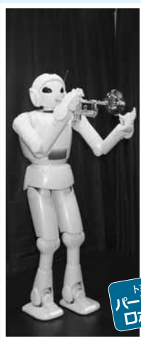
トヨタ パートナー ロボット