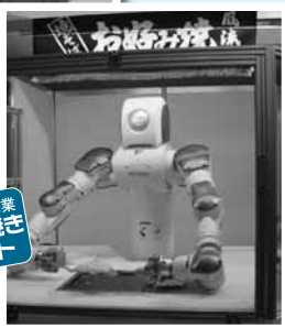
東洋理機工業 お好み焼き ロボット