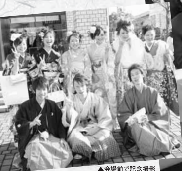
▲会場前で記念撮影