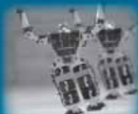
▲人間型ロボット「ロボナビ」