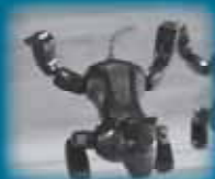
▲子犬ロボット「ジェニボ」