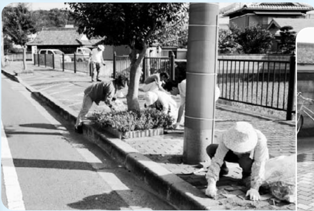
▲ クロガネモチロード清掃活動の様子 ▶