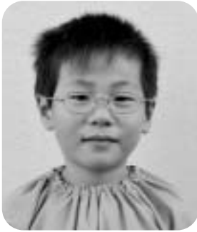
さけもと かけるくん(6さい)

おとうさん ポケモンのゲーム やらしてくれて ありがとう。たのしかったよ。また オークワへ いきたいね。