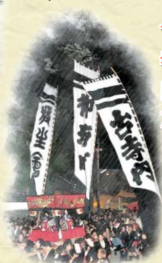
大きく古寺内と記された幟

その後、現在の日高別院のある場所に「日高坊舎」を建立し、土地の人々が御坊様と呼んで崇拜し、活気のある寺内町として発展してきました。 現在では古寺内をしのばせるものはほとんどありませんが、御坊祭の氏子組の「御坊町」の五反幟には大きく古寺内と記されており、これからも人々の記憶にいつまでも残ることでしょう。