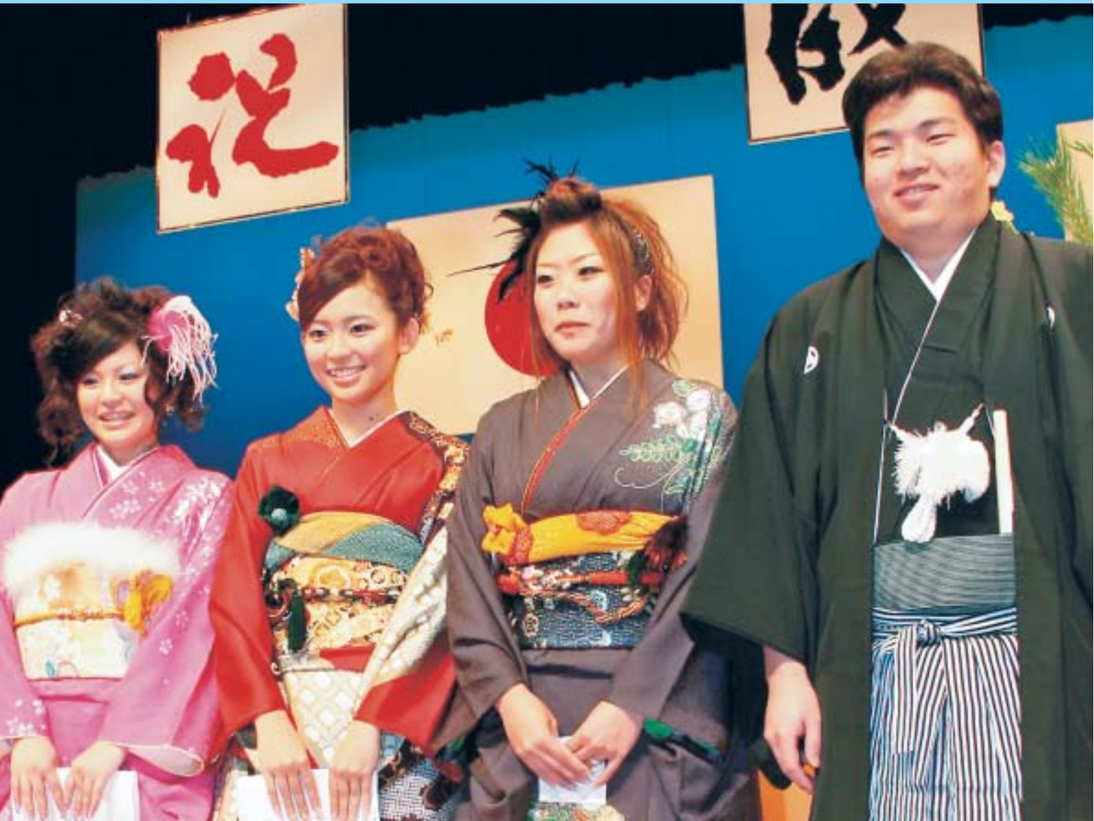
御坊市成人式（誓いの言葉発表者）