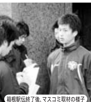
箱根駅伝終了後、マスコミ取材の様子

箱根駅伝について たくさんの方に応援していただき、自分なりに精一杯頑張りました。調子は良くなかったんですが、無事タスキをつなぐことができました。 なぜかわかりませんが、意外と緊張せずに走れました。前の晩もよく寝られました(笑)。 ただ、当日までに自分の調子をピークの状態に持っていけなかったのが悔しいです。昨年11月の全日本大学駅伝の