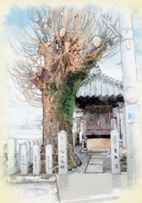
中町の下川沿いにある通称「茶免の地蔵」

寺内町を取り囲むように流れる下川は、外敵を防ぐ環濠の役割を果たしているといわれていますが、江戸時代になると日高川河口を利用した廻船業や木材問屋などが栄え、下川の川沿いにも当時の面影を残す倉庫がひっそりとたたずんでいます。 中町三丁目付近には、当時周辺で栽培されていた茶の課税に苦しんでいた住民が、お茶好きの役人に美味しいお茶をもてなし、うまく「免税」を約束させたという逸話とともに、通称「茶免の地蔵」と呼ばれる延命地蔵尊が祀られた祠や水害の碑などが並んでいます。