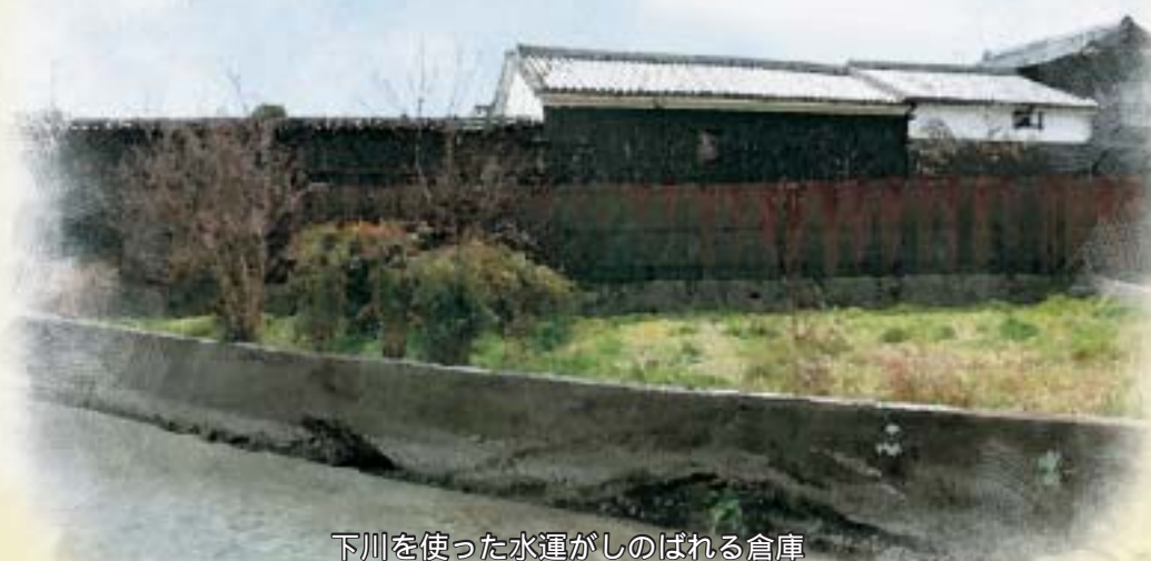
下川を使った水運がしのばれる倉庫

寺内町を取り囲むように流れる下川は、外敵を防ぐ環濠の役割を果たしているといわれていますが、江戸時代になると日高川河口を利用した廻船業や木材問屋などが栄え、下川の川沿いにも当時の面影を残す倉庫がひっそりとたたずんでいます。 中町三丁目付近には、当時周辺で栽培されていた茶の課税に苦しんでいた住民が、お茶好きの役人に美味しいお茶をもてなし、うまく「免税」を約束させたという逸話とともに、通称「茶免の地蔵」と呼ばれる延命地蔵尊が祀られた祠や水害の碑などが並んでいます。