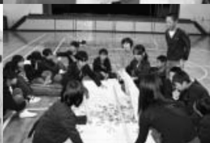
火災の煙体験（上） 担架作成訓練（下）