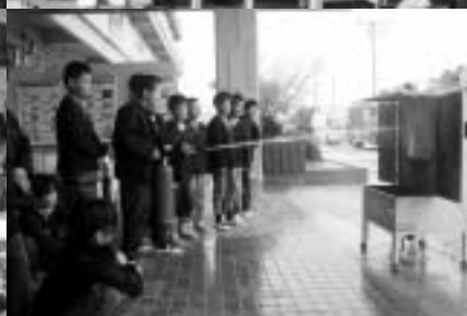
起震車体験（上） 消火訓練（下）