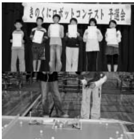
ロボットコンテスト予選会の様子

主催 きのくにロボットフェスティバル 実行委員会 問い合わせ 御坊商工会議所 22-1008