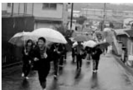
塩屋小学校から関西電力(株)宅前の高台までの避難訓練

地震の揺れを感じたら、まず、揺れから身の安全をはかり、ただちに、海岸から「より遠く」ではなく、「より高い」場所へ避難することが大切です。