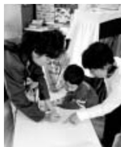
「171」を利用した引渡し訓練

今回の訓練では、幼稚園と保護者の間で「171」を利用して、情報伝達、引渡し訓練を行いました。