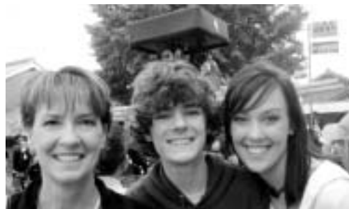
アメリカの家族(左から母・妹)が「御坊祭」へ

そのあと、お宮へ「御坊祭」を見に行きました。やっぱりインパクトが強かったです。家族は「四