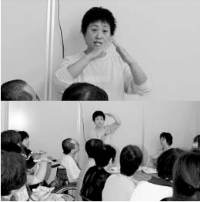
手話学習会の様子

そのお客様に申し訳ないことをしたと思うと同時に商品の説明ができなかった自分自身に腹がたちました。「世の中には、いろんな方がいるんだなあ。私ももつと勉強しないといけない」と思い、それから手話サークルに入って手話の勉強をはじめました。 人生、何でも習っておいて損をすることは無いと思います。いろんな経験があとあと役立つことがあります。手話の勉強も続けてきて良かったと思います。