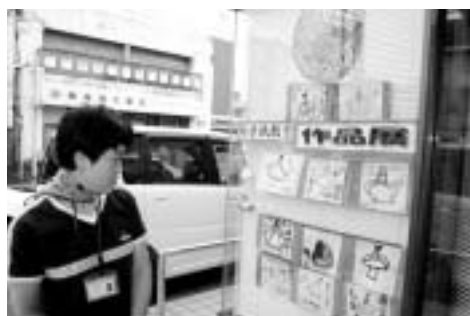
「絵手紙教室作品展」をしています

そこで、折込チラシや店頭のPOP広告を作る仕事をしていました。そんな関係もあって今の職場でも、機関紙「あおぞら通信」の作成・発行や事務所入