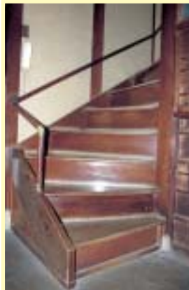
応接室へのアプローチ階段

本建物の2階に応接室を配置している。2階応接室へのアプローチ階段は桜材で施工されており、みごとなものである。ラセン階段を登った右手に応接室があり、天井は2.9m程度で、かなり高い折天井となっている。材料は折上は一部カシュー仕上げ、天井板はコルク仕上げである。家具については、すべて造付としており内装面と同じ仕上げとなっている。かなりコーディネートされた職人としての意気が入っている。