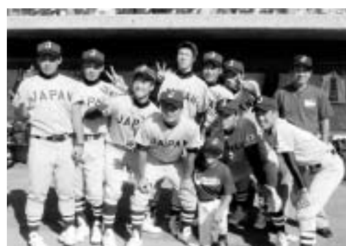
全日本選抜メンバーと記念撮影(左端)