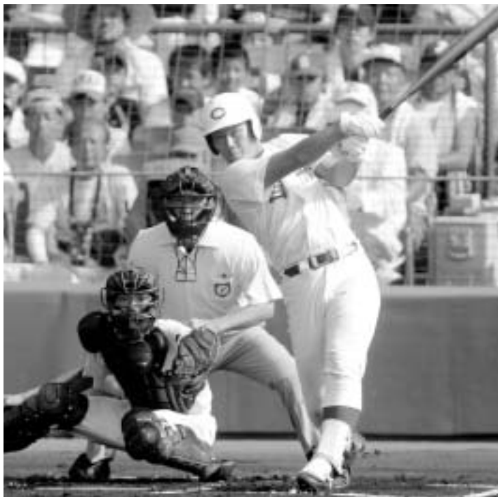
1 回戦 県岐阜商戦でのホームラン

田中投手はこれまで対戦した中で、最高のピッチャーでした。マシンで練習していたのとは全然違いました。変化球で打ち取られたので、もう一度対戦する機会があれば、今度はストリート勝負をしたいです。