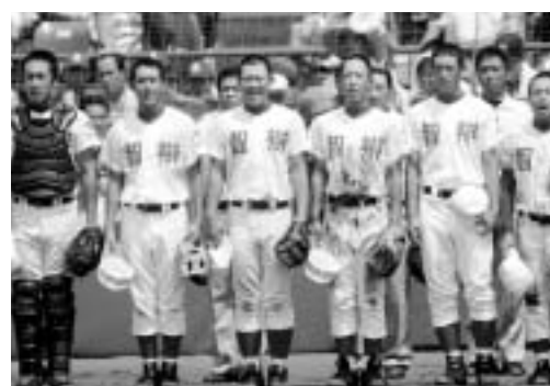
勝利して校歌斉唱(左から3番目)

アメリカでは、 Yankeesの松井選手とも対面したそうですが、会ってみてどうでしたか？