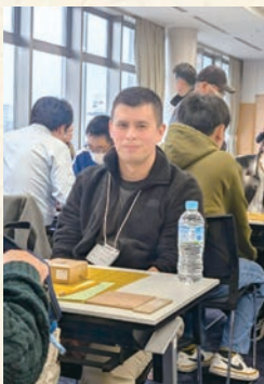
「和歌山市将棋大会」

では、なぜ私はこんなにたくさんさんの大会に出るのでしょいか？ それは、毎日一緒に遊んでくれる人を見つけるのが難しいからです。私は普段、持っている趣味をどれも毎日10分から1時間くらい練習しています。練習といっても、オンラインで遊んだり、本で勉強したり、パズルを解いたりすることが多いです。大会に行くのは、同じ趣味に情熱を持つ人たちと実際に出会える、とても良い機会です。ぜひ怖がらずに挑戦してみてください。結果は気にせず、楽しんで、毎日少しずつ上達していきましょう。何か一緒に遊びたいゲームがあれば、ぜひ教えてください！