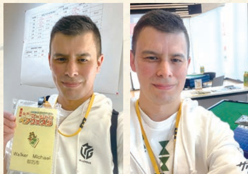
「第3回 健康マーじゃんペアフェスタ」