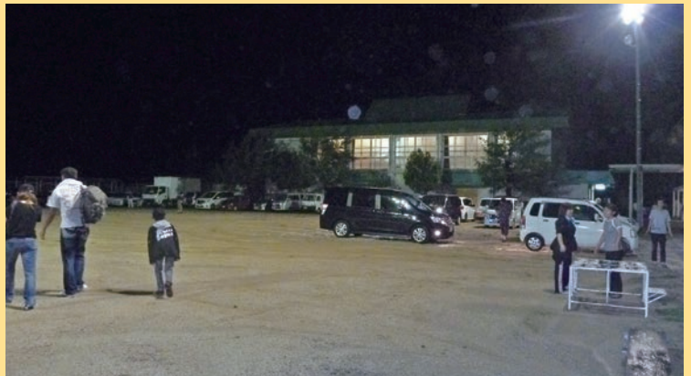
平成23年台風12号で学校の避難所へ避難する人々

また、指定避難所へ行くことだけが「避難」ではありません。安全な場所にある親族や知人の家など、いざという時にどこへ身を寄せるか、平時からご自身に合った避難先をイメージしておきましょう。