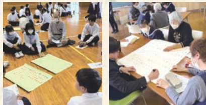
認知症講座に参加していただき、中学生と一緒に 「暮らしやすいまち」について考えました。

活動時の状況に応じて、福祉関係機関や民 生委員・児童委員と連携、協力しています。