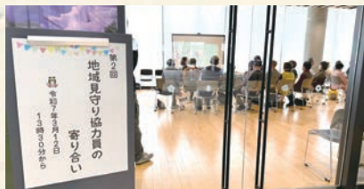
年に1回、それぞれの活動報告や研修会、交 流会を実施しています。

日常のちよっとした「声かけ」や「気にか け合い」が、地域で安心して暮らすため にとても重要だと言われています。