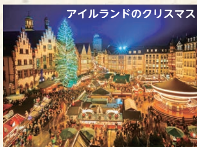
アイルランドのクリスマス

ご覧の通り、アイルランドと日 本の習慣は大きく異なりますが、 どちらの国もユニークで興味深い 方法でクリスマスを祝っていま す。私はアイルランドのクリスマ スが大好きですが、日本でクリス マスを体験できることもとても嬉 しく思います。