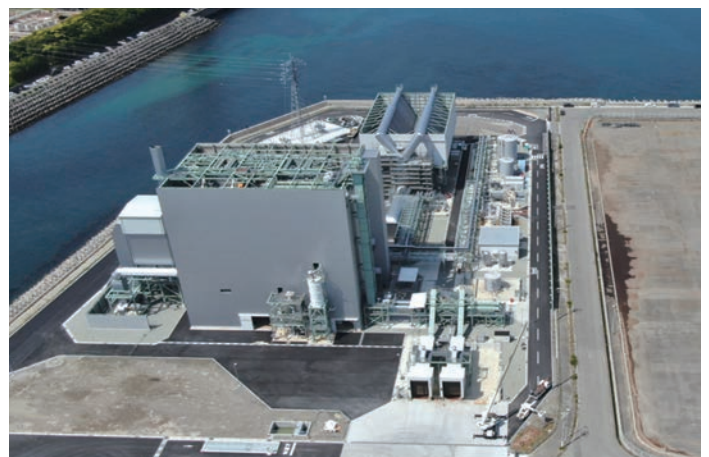
和歌山御坊バイオマス発電所