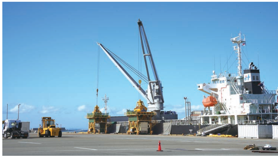
荷役の様子（第1岸壁）

大量の工業原料やエネルギー資源を受け入れる拠点として機能を強化するとともに、臨海部の交通整備や周辺地域との連携を進めることで、地域の産業と市民のくらしの両方を支える基盤へと発展しています。