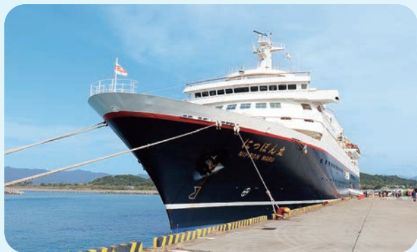
クルーズ船寄港時の様子

日高港では、国際物流ターミナルなどの施設整備が進んだことで、大型クルーズ船の寄港が可能となりました。クルーズ船の寄港時には、港で住民・乗船客が交流できる歓迎イベントを開催するなど、御坊・日高地方の魅力のPRに努めています。令和8年1月に、「にっぽん丸」の寄港が予定されているなど、魅力ある寄港地観光の拠点としても注目されています。