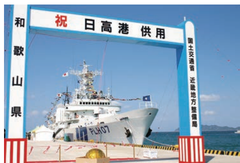
日高港暫定供用開始

日高港は、古くから川船と海運をつなぐ重要な拠点として発展し、木材をはじめとする紀中地域の物流を支えてきました。とくに、地域の代表的な地場産業である製材業向けに、外材（輸入木材）の原木を運ぶ港として発展し、機帆船による二次輸送で木材を供給する「流通港湾」としての役割を担っていました。しかし当時の日高港には、いくつかの課題もありました。外航船などの大型船が入港できないこと、荷役作業が非効率であること、輸送コストが高いことなどです。